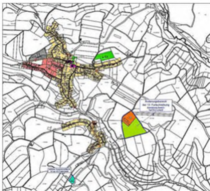
Auszug aus der Flächennutzungsplanänderung