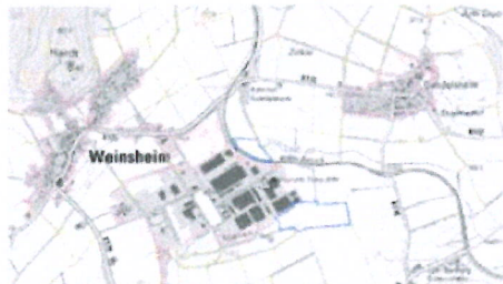
Abb.: Lageübersicht mit nachträglich blau eingetragenen Änderungsbereichen

Die vorliegende Planänderung zum Flächennutzungsplan der Verbandsgemeinde Prüm betrifft zwei einzelne Änderungspunkte in der Ortsgemeinde Weinsheim. Der Änderungsbereich umfasst insgesamt eine Fläche von rund 8,5 ha und überdeckt teilweise den Geltungsbereich des rechtskräftigen Bebauungsplans „Industriegebiet“ sowie den planungsrechtlichen Außenbereich gemäß § 35 BauGB. Teil der 8,5 ha Änderungsfläche sind 5,9 ha gewerbliche Baufläche und die Neuausweisung von ca. 2,6 ha Ausgleichsfläche.