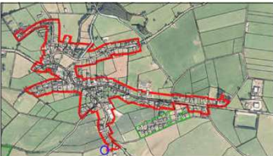
Lage des Plangebiets (blauer Kreis)

Der Geltungsbereich umfasst die Grundstücke Gemarkung Roth bei Prüm, Flur 10, Flurstücke 21/3 tlw. und 21/6 tlw. (beide ehemals 21/2 tlw.). Die Lage des Plangebiets und der Geltungsbereich der Satzung sind aus den nachfolgenden, unmaßstäblichen Kartenunterlagen ersichtlich.