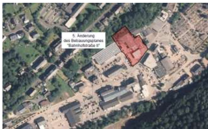
Lage des Plangebiets (rot schraffiert)

Die Lage des Plangebiets und der Geltungsbereich sind aus den nachfolgenden, unmaßstäblichen Karenunterlagen ersichtlich.