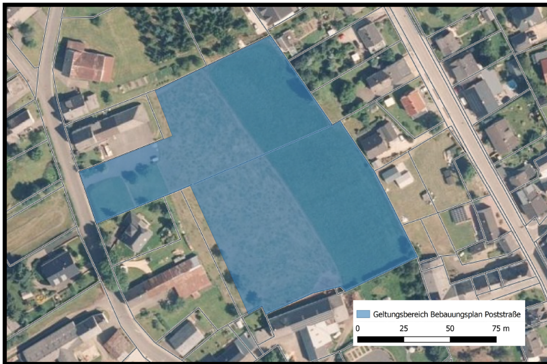
Abbildung 1: Geltungsbereich des Bebauungsplans 1