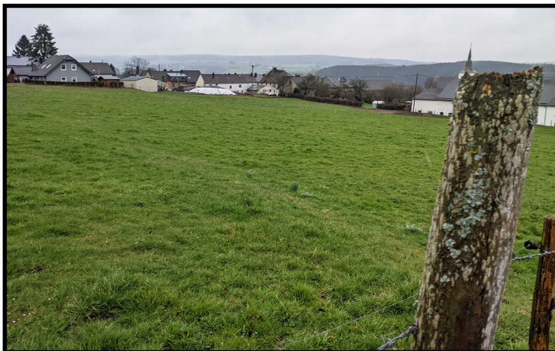
Abbildung 2: Blick auf die Fläche nach Südosten